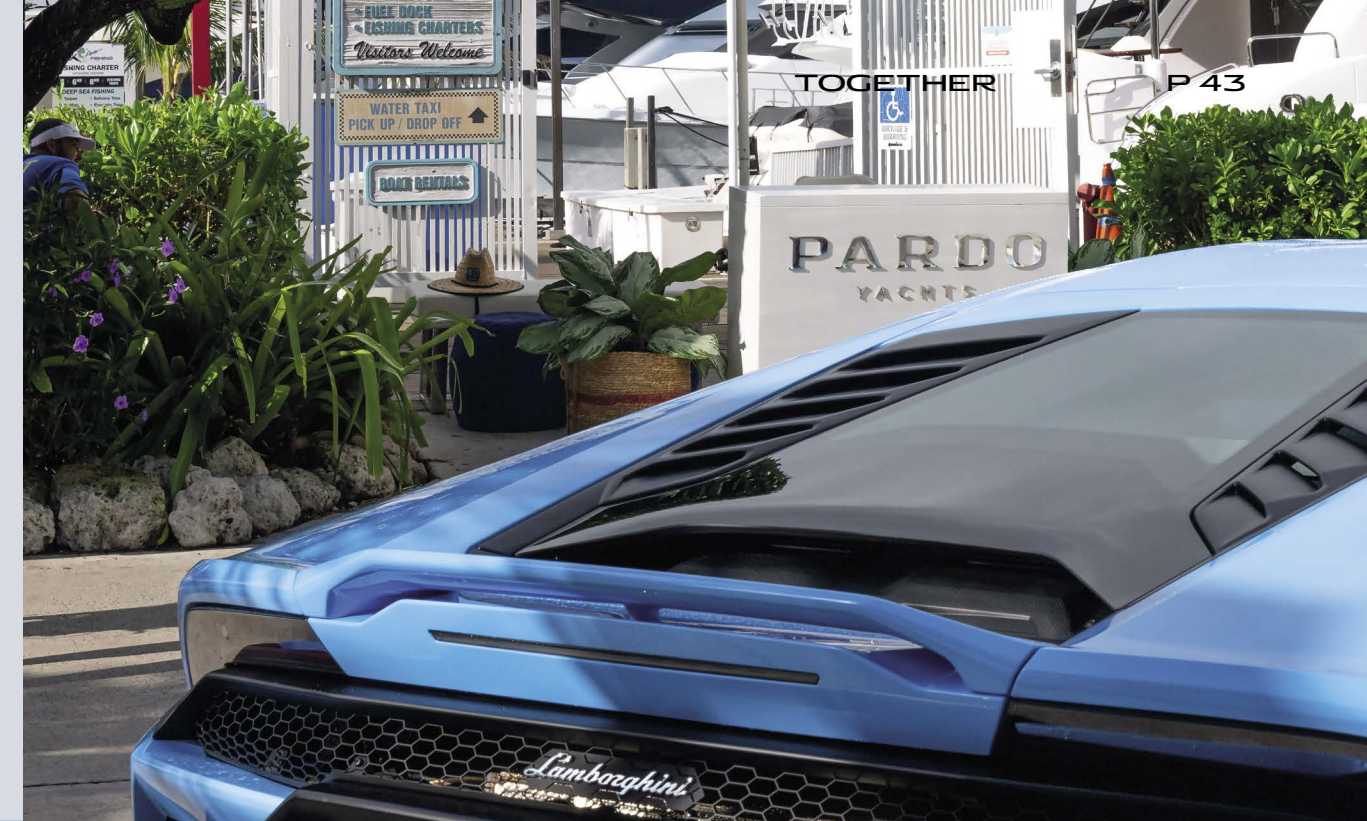
MIAMI - PARDO YACHTS & LAMBORGHINI