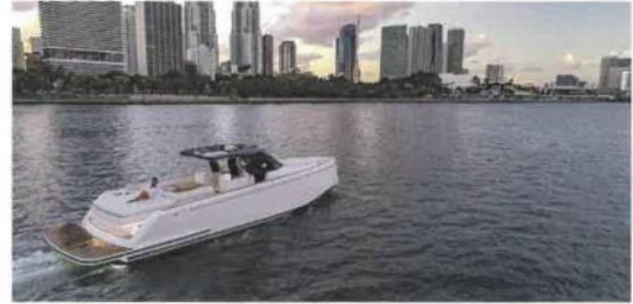
Il Pardo 50 ha uno scafo a V profonda a geometria variabile. L'imbarcazione si distingue per le alte prestazioni unite a un design unico Made in Italy

10-12 nodi, o meglio: voleva fare 10 nodi per l'80% della vacanza in mare, ma per le traversate richiedeva una velocità di 20 nodi. Da qui abbiamo cominciato a studiare una carena che avesse entrambe le caratteristiche. Sono nate così delle carene piuttosto particolari, senza pattini. Nel 2010 i Cantieri Navali Estensi hanno cambiato proprietà, in