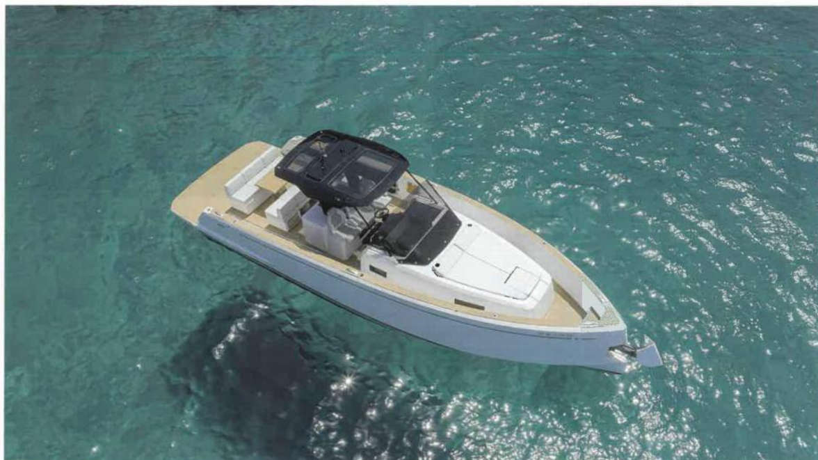
Il Pardo 38 ha vinto il titolo di European Powerboat of the Year allo scorso Boot Düsseldorf nella categoria barche a motore fino a 12 metri

Lei ha ormai circa quarant'anni d'esperienza alle spalle. Da dove ha cominciato?