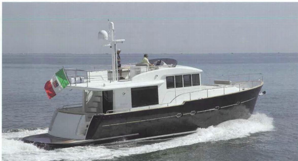
Il Maine 530 è una navetta con una grande abitabilità di bordo, ideale per crociere a lungo raggio o lunghe permanenze a bordo