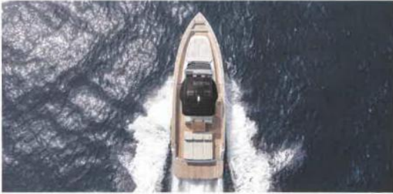
Il Pardo 43 si caratterizza per una coperta walk around che garantisce spazio, sicurezza e facilità di movimento per raggiungere la zona prendisole di prua