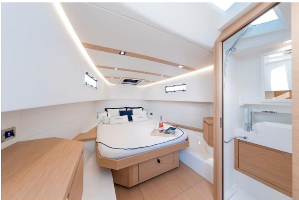
Pardo 38, interni

Caratteristica di tutte le tipologie di motorizzazione, è la possibilità di installare il joystick che permette di controllare la barca al meglio.